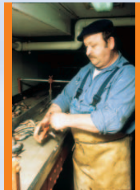
Ein Hering wird gekelt.

Gleich nach dem Kehlen wird der Hering in eine Salzlake gelegt, in der er reifen kann. Sobald er einen bestimmten Geschmacks-