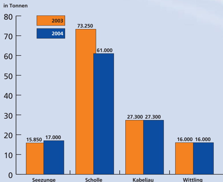
TACs 2003 und 2004