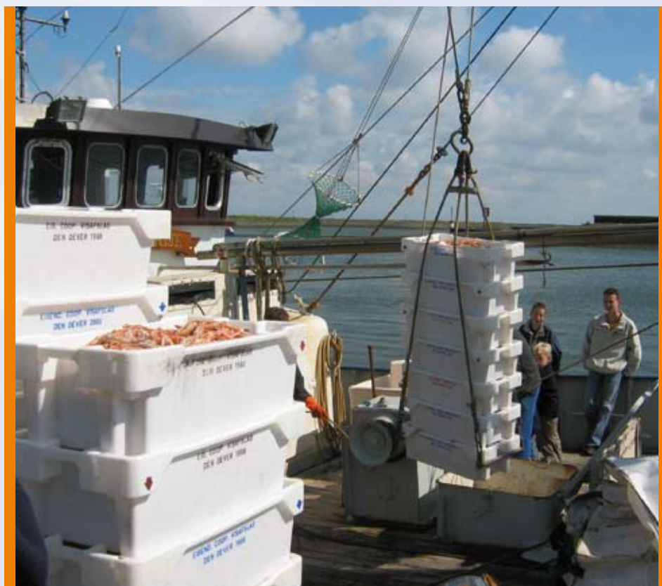
Aanvoer Langoustines Nederlandse afslagen

Enkele vissers hebben een aanvraag ingediend om te beoordelen of zij aan de eisen kunnen voldoen voor MSC-certificering. Veel betrokken vissers en handelaren vinden dit, met het oog op toekomstige ontwikkelingen in de markt, een belangrijk keurmerk.